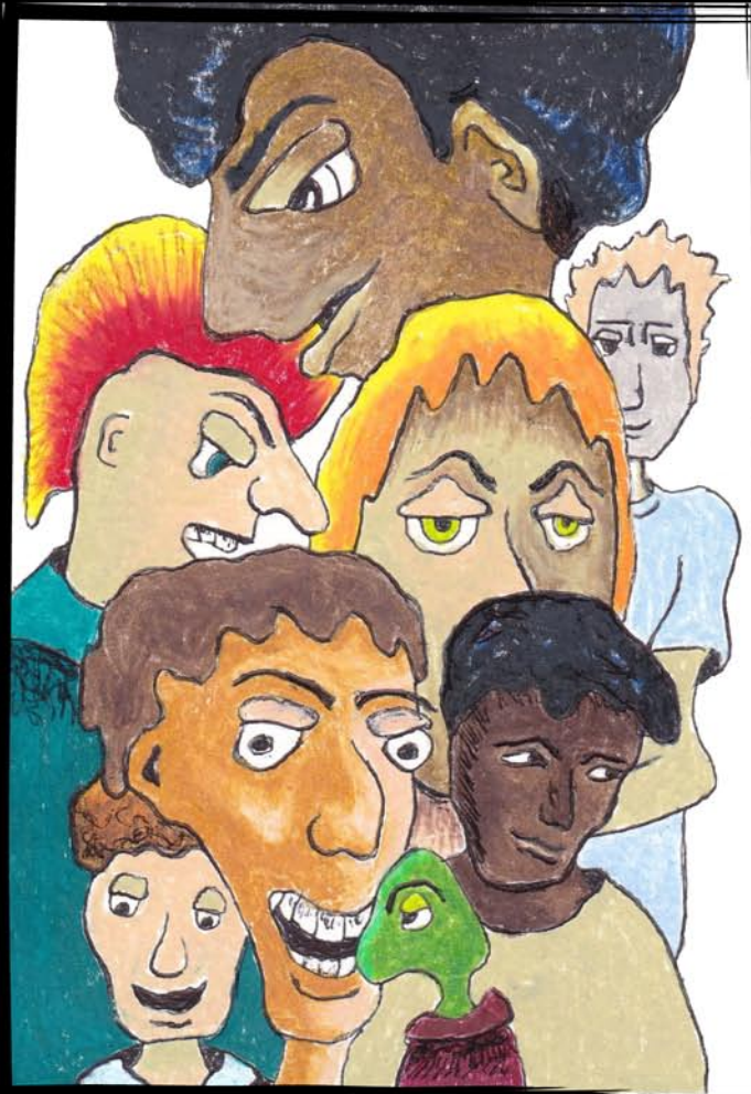
A Turtle in a Turtleneck Une tortue dans un cou de tortue 10X15 CM mixed media framed 18X24 CM, ready to hang encadré 18X24 CM, prêt à accrocher