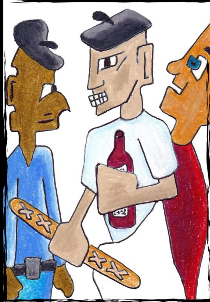
Sunday Brunch 50 EU/USD Brunch du Dimanche 10X15 CM mixed media framed 18X24 CM, ready to hang encadré 18X24 CM, prêt à accrocher