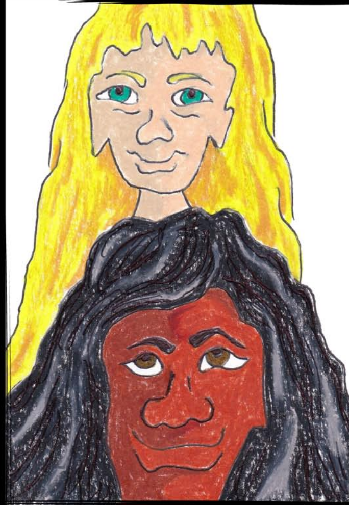
Harold and Maudeline 50 EU/USD Eruld et Maudeline 10X15 CM mixed media framed 18X24 CM, ready to hang encadré 18X24 CM, prêt à accrocher