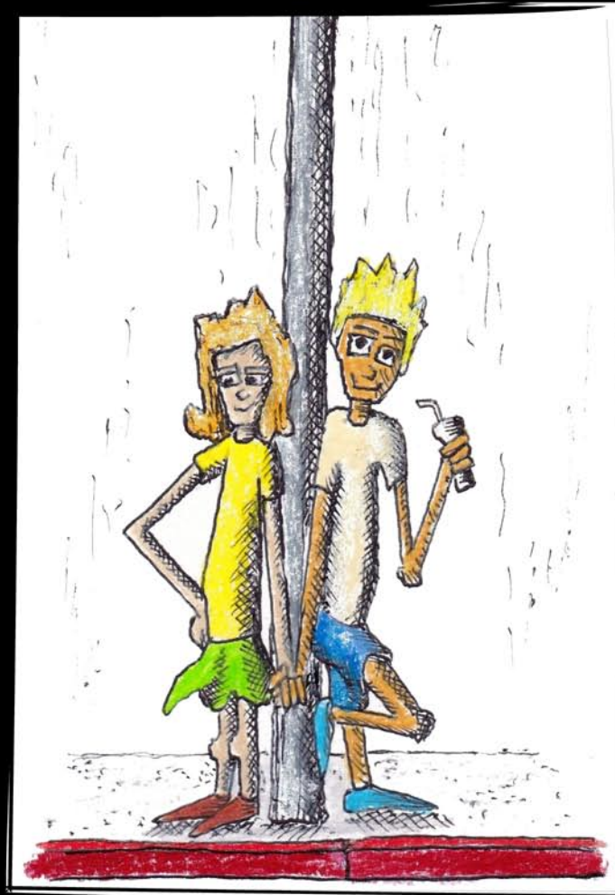
Love on the Streets L'amour dans les rues 10X15 CM mixed media framed 18X24 CM, ready to hang encadré 18X24 CM, prêt à accrocher