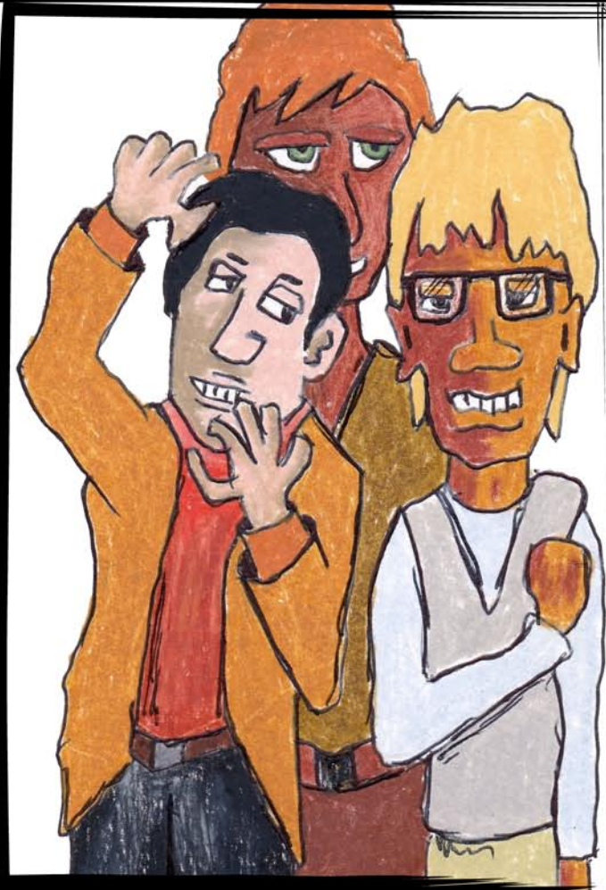
The Boyz Les Mecs 10X15 CM mixed media framed 18X24 CM, ready to hang encadré 18X24 CM, prêt à accrocher