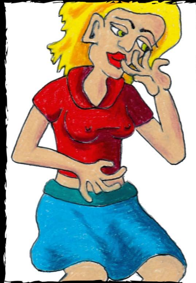
Girl Blushing Fille rougit 10X15 CM mixed media framed 18X24 CM, ready to hang encadré 18X24 CM, prêt à accrocher