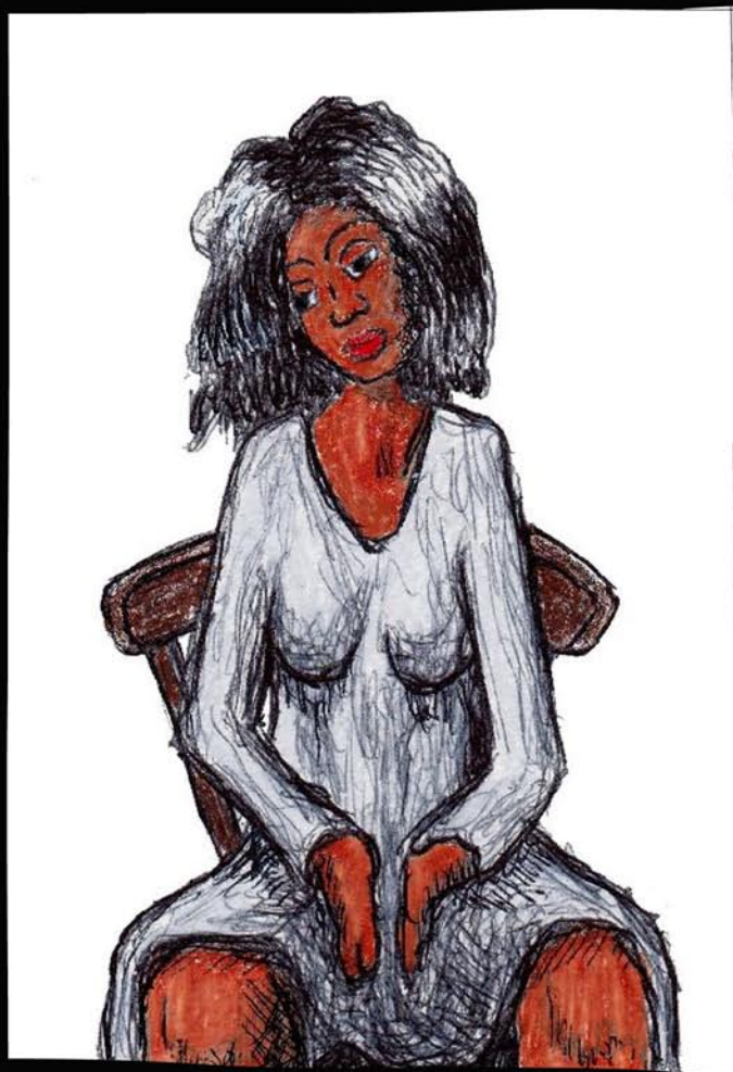
Girl Seated Fille assise 10X15 CM mixed media framed 18X24 CM, ready to hang encadré 18X24 CM, prêt à accrocher