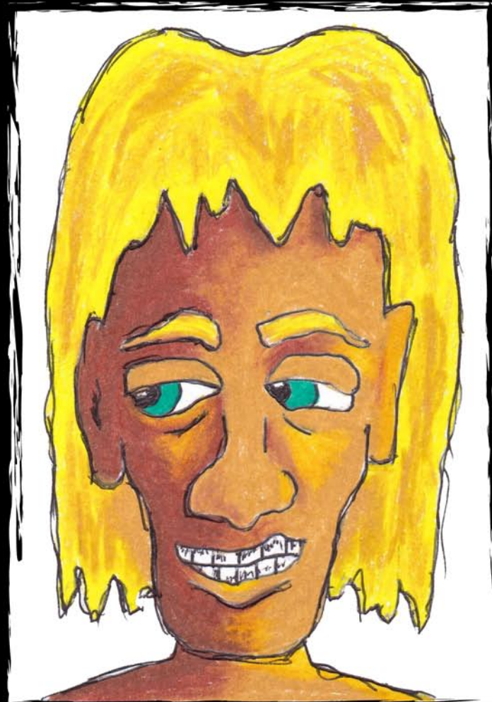
Krusty 50 EU/USD Krusty 10X15 CM mixed media framed 18X24 CM, ready to hang encadré 18X24 CM, prêt à accrocher