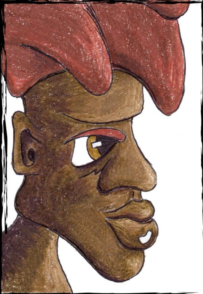
Robaire Robert 10X15 CM mixed media framed 18X24 CM, ready to hang encadré 18X24 CM, prêt à accrocher