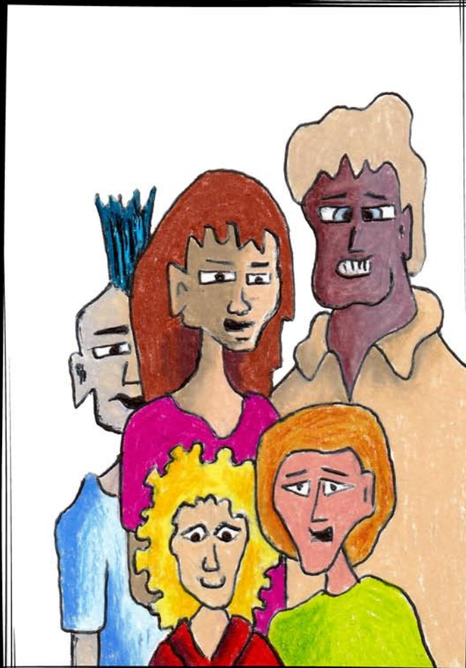
Five Strangers Come for a Sitting 50 EU/USD Cinq inconnus viennent s'asseoir 10X15 CM mixed media framed 18X24 CM, ready to hang encadré 18X24 CM, prêt à accrocher